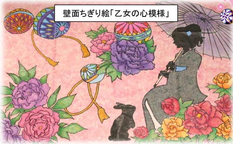
壁面ちぎり絵「乙女の心模様」