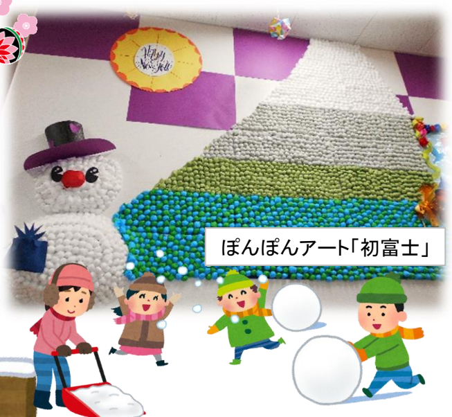
ぼんぼんアート「初富士」