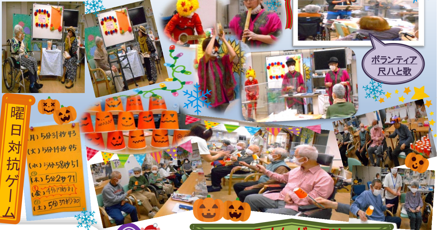
ボランティア 尺八と歌